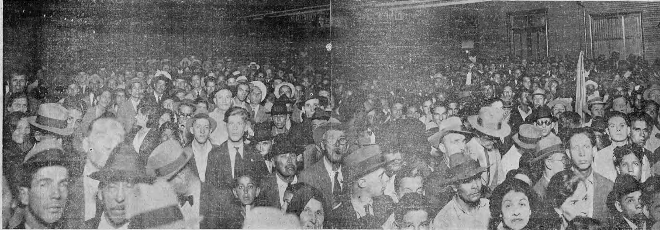
IMPONENTE VISTA PANORAMICA DE LA REUNION CORTESISTA DEL JUEVES EN ESTA CAPITAL