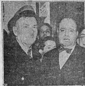
Recoge el grabado varios aspectos del recibimiento que se le hizo el viernes pasado al general Calles...