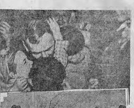
Recoge el grabado varios aspectos del recibimiento que se le hizo el viernes pasado al general Cardenas...